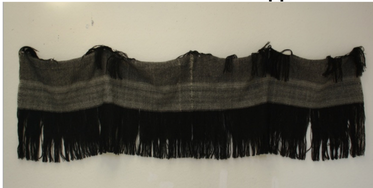
▲ Verk av Matilde Westadvik Gaustad på Galleri Fisk.