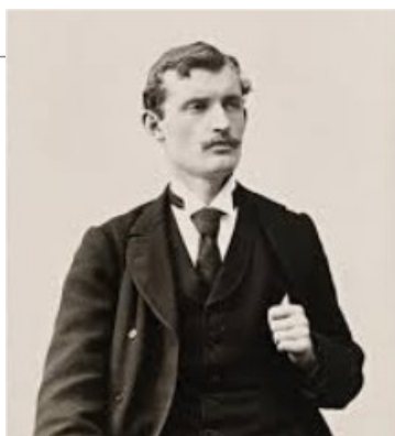
▲ Edvard Munch.

Og løfter vi blikket litt, for eksempel til en maler som Edvard Munch, Så veit vi at han ofte satte maleriene sine ute for at vær og vind skulle ta seg av dem. Var da maleriene «ferdige» når Munch hadde gjort sitt siste penselstrøk? Eller når vær og vind hadde fått behandle dem?