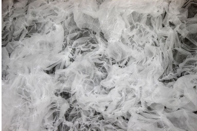
▲ Fra utstillinga