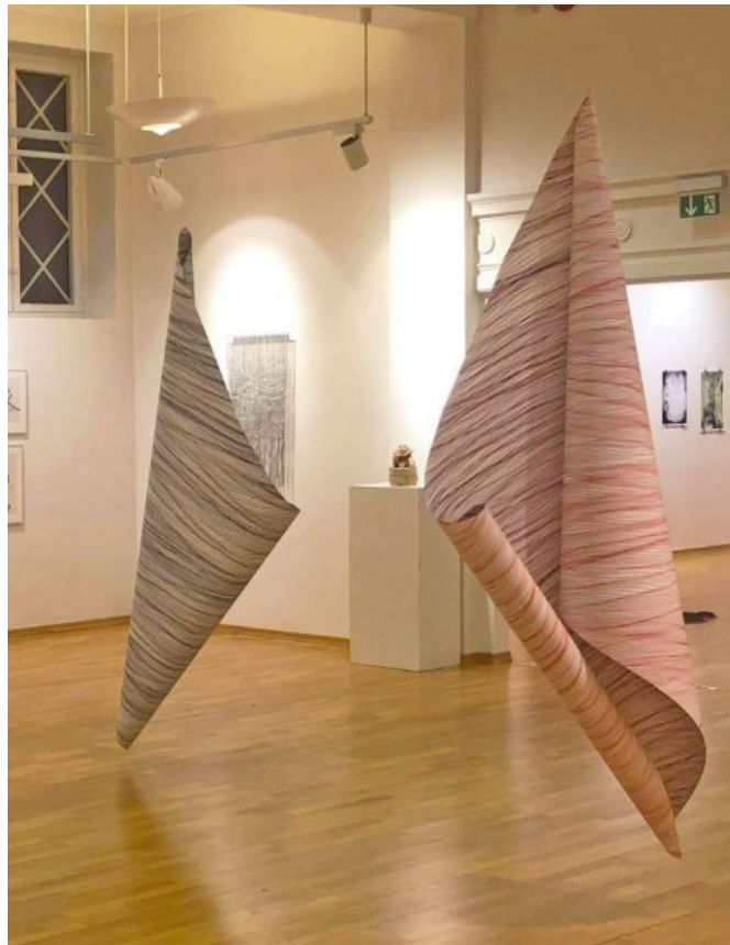
▲ Fra utstillinga