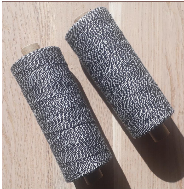
▲ Bockens Lingarn, hvitt og svart tvunnet.

ockens Lingarn fra Holma-Helsinglands AB i Forsa, Sverige, er velkjent og kjært både i Sverige og i hele verden for øvrig. Lingarn egner seg både til renning og innslag i vevnaden, men mest brukt er det vel som renningsgarn. Bockens har nylig kommet i en ny og spennende variant: I tillegg til de vanlige fargene leveres Bockens Lingarn nå i en variant med hvitt og svart garn tvunnet (se bildet).