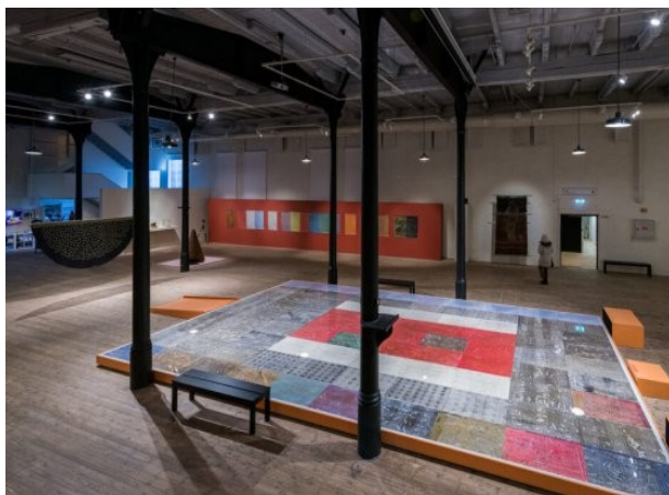
▲ Fra utstillinga