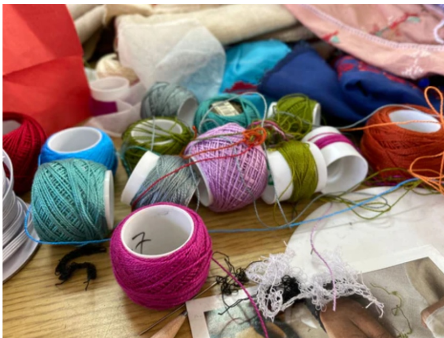
▲ Garn til tatreez-broderi fotografert i Am'ar-flyktningeleiren i Palestina. (Fra: «Tradutional Embroidery; A Brief History of Palestinian Tatreez.»)

Tradutional Embroidery; A Brief History of Palestinian Tatreez https:// handmadepalestine.com/blogs/ news/tatreez