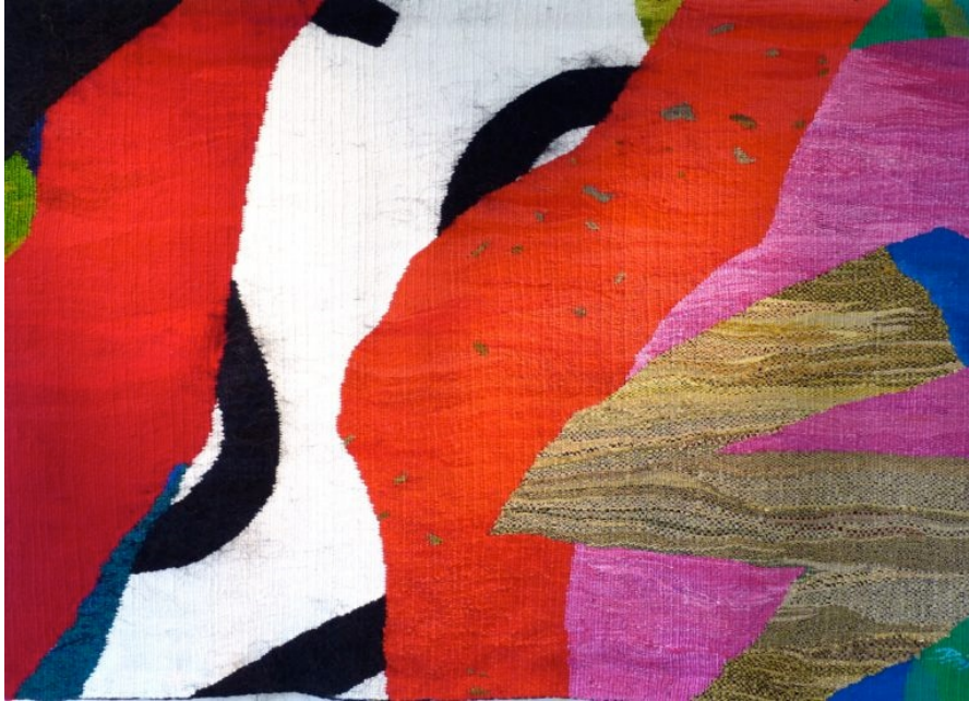
▲ Åse Frøyshov: GIMSINGHOVED KULTURCENTER, Jylland 2013 Separatutstilling.

form. Hun beveget seg utenfor det rettvinklede formatet som er det mest vanlige i billedvev. Med abstrakte motiv, klingende koloritt og original bruk av materiale og teknikk fant hun et kunstnerisk ståsted. En treffende betegnelse på verkene er monumentalitet.»